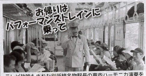
テレビ放映もされた別所線名物駅長の車内ハーモニカ演奏を聞きながら、復路は上田駅までゆったり帰れます