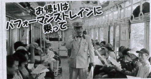
テレビ放映もされた別所線名物駅長の車内ハーモニカ演奏を聞きながら、復路は上田駅までゆったり帰れます